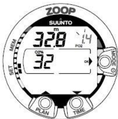
図 4.17 NITOROX 設定 スクロールボタンで酸素割合 (O 2 %)、酸素分圧 (PO 2 ) の変更、 A ボタン (TIME) で決定 正 : Aボタン (MODE)

図は酸素割合 32%、酸素分圧 1.4bar、最大許容深度 32.8m に設定した例 正 : 設定中